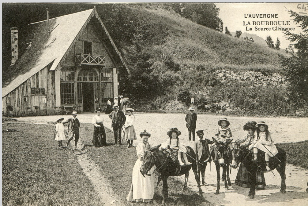
Carte n° 64 - La Bourboule, Source Clémence